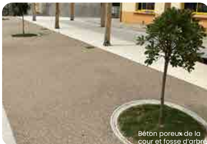
Béton poreux de la cour et fosse d'arbre