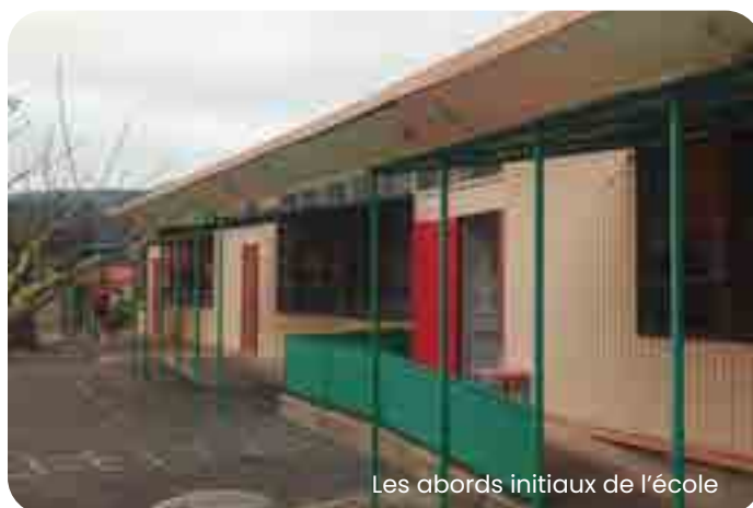
Les abords initiaux de l'école