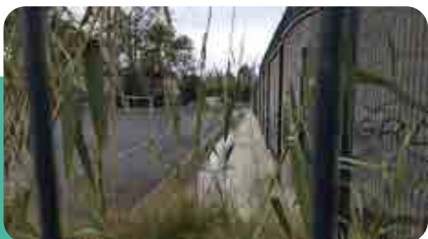
→ Exutoire du parking et aire de jeu submersible