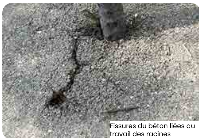
Fissures du béton liées au travail des racines