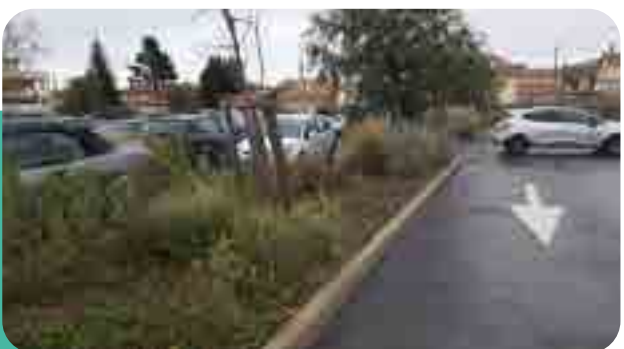
→ Noue d'infiltration sur le parking