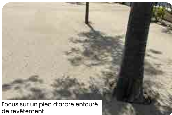
Focus sur un pied d'arbre entouré de revêtement