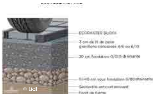
Détails du lit de pose et de la conception des Ecoraster