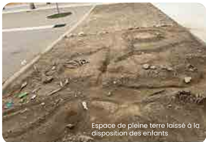
Espace de pleine terre laissé à la disposition des enfants