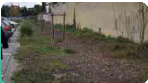
→ Noue d'infiltration en amont du parking

Le désherbage sur les places de stationnement doit s'effectuer à l'eau chaude, très régulièrement les 2 premières années puis beaucoup moins fréquemment.