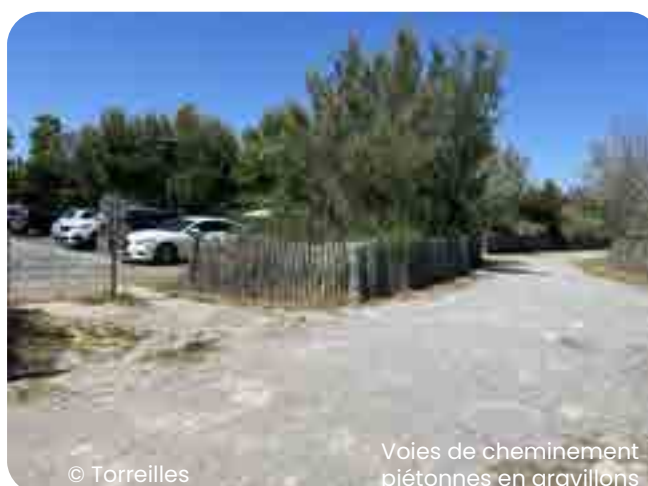
Voies de cheminement piétonnes en gravillons