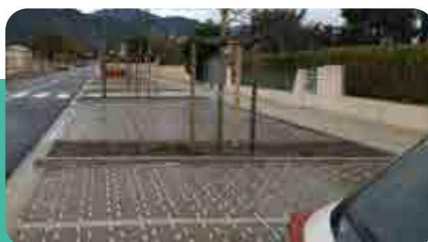
→ Places de stationnement en pavés et graviers