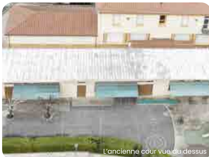
L'ancienne cour vue du dessus