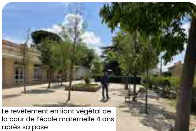
Le revêtement en liant végétal de la cour de l'école maternelle 4 ans après sa pose

En accord avec les zones d'écoulements, la commune aurait laissé plus de pleine terre et aurait également réduit l'emploi d'enrobés drainants de un tier.