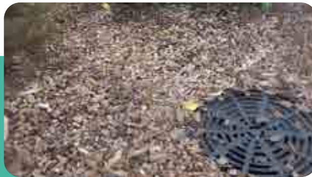
→ Regard vers réseau de connexion des noues d'infiltration